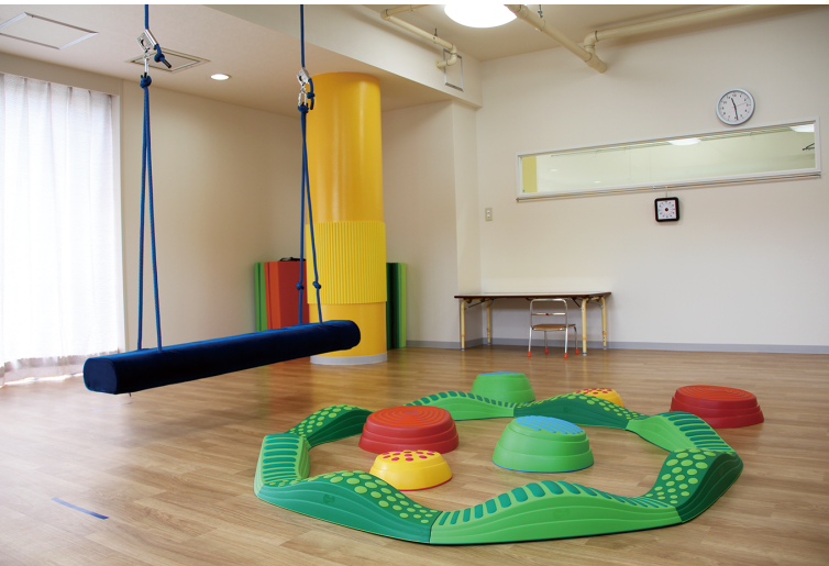
つり具利用の感覚統合遊び